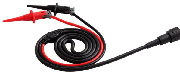
BNC 转测试勾连接线 (CK-311)